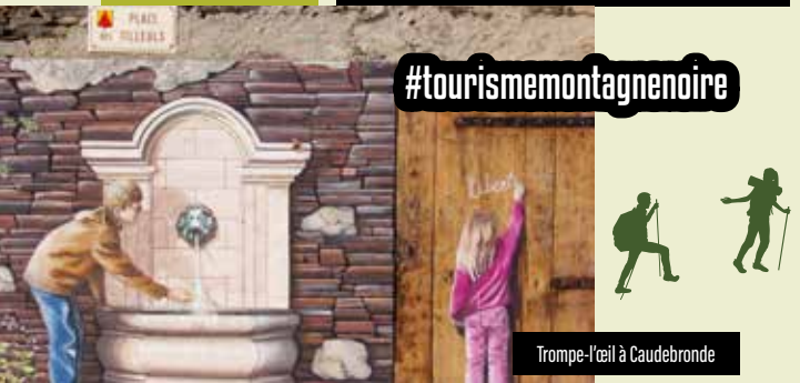
Trompe-l'œil à Caudebronde