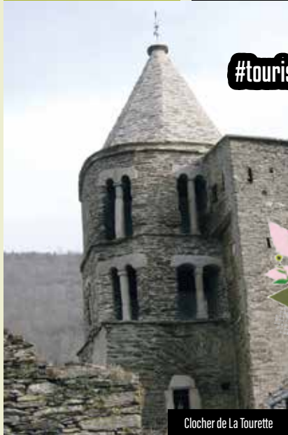
Clocher de La Tourette