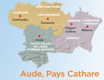
Aude, Pays Cathare

AUDE PAYS CATHARE | VACANCES SÉRÈNES Une destination "Secure"